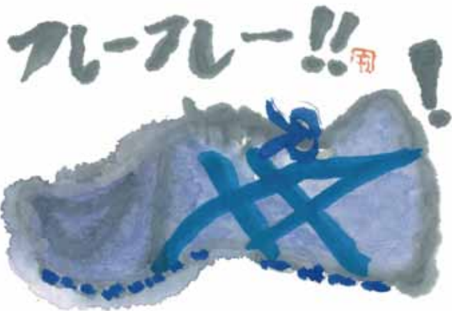
神戸市立若宮小学校6年生による絵手紙作品