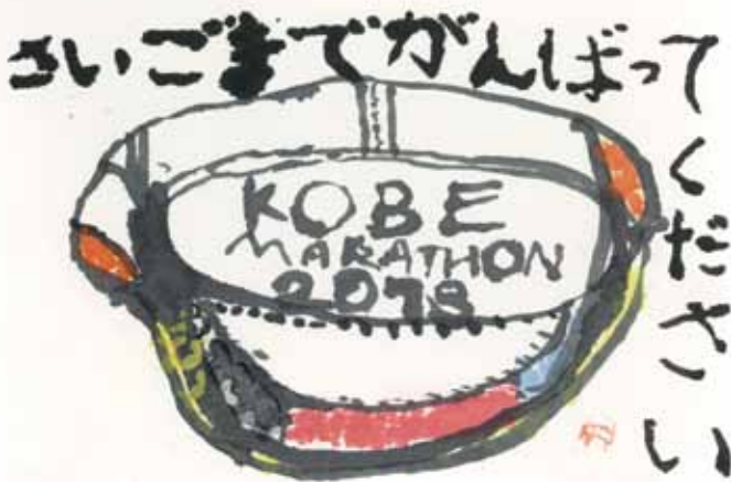
神戸市立若宮小学校6年生による絵手紙作品